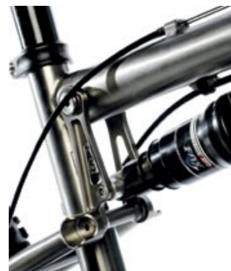
Rank titanium als kunst