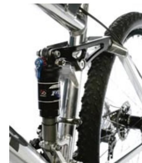
Vakwerk gemaakt met de CNC-machine

timeter veerweg is perfect afgesteld, zodat je er het uiterste uit kunt halen. Omdat de geometrie veel rust in het rijgedrag van de fiets brengt, kun je de remmen gerust loslaten in een afdaling. Je kunt je volledig concentreren op het sturen. Ook op technische paden met veel obstakels werkt de Turner subliem. Door het lage gewicht kun je er een perfecte marathonbike mee opbouwen, met behoud van zijn allroundkwaliteiten. Welk van de twee je kiest hangt van je rijstijl en inzetgebied af. Met je eigen keuze voor de afmontage creëer je een persoonlijke en dus unieke winnaar. 🏆